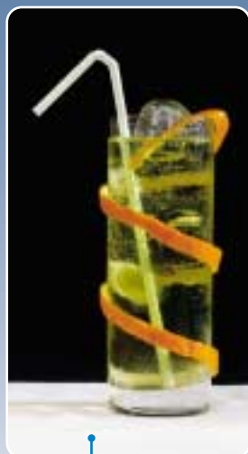
5.18/1 | Caribbean Highball