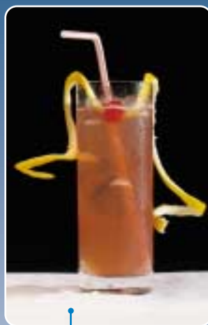
5.18/2 | El Diabolo