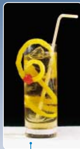
5.18/3 | Horse's Neck