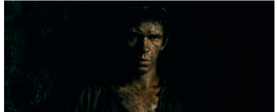
Abb. 1.1-22 Das Parfum

Das Beispiel des Mordes von Grenouille an dem Mirabellenmädchen zeigt, wie der Einsatz des Erzählers konzipiert ist. Die gesamte Sequenz, wie der Protagonist der Verkäuferin begegnet, ihren Duft in sich aufnimmt, ihr folgt und sie, wie es scheint, versehentlich tötet, wird ohne Erzählerkommentar szenisch dargestellt. Ebenso wird sein Versuch, den flüchtigen Geruch der Toten in sich aufzunehmen, durch Musik, Licht, Kameraarbeit und Darstellung inszeniert. Erst später, als Grenouille über das Ereignis nachdenkt (Abb. 1.1-22), setzt die Erzählerstimme ein, die seine Reflexionen auf den Punkt bringt: