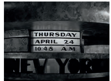
Abb. 1.1-6, -7, -8 Spiel mit dem Tode

Die Ereignisse, die zu der geschilderten Ausgangssituation geführt haben, werden sodann in einer Rückblende gezeigt (durch eine Überblendung der großen Uhr um 36 Stunden zurück). In der Folge wird die Ich-Erzählung jedoch nicht mehr aufgenommen. Auch wenn die Rückblende die dramatische Ausgangssituation wieder einholt, ist die Darstellung zwar auf den anfangs eingeführten Erzähler konzentriert, es werden jedoch Ereignisse gezeigt, von denen er, der Logik der Geschichte folgend, nichts wissen kann. Die personalisierte Erzählerstimme in diesem Beispiel wird also nicht konsequent durchgehalten. Sie ist als Genre-Konvention zu verstehen, die den Zuschauer möglichst direkt an die Geschichte heranführen soll. Außerdem betont sie die Unvermeidlichkeit der Ereignisse, denen die Hauptfigur von Anfang an bereits ausgeliefert ist.