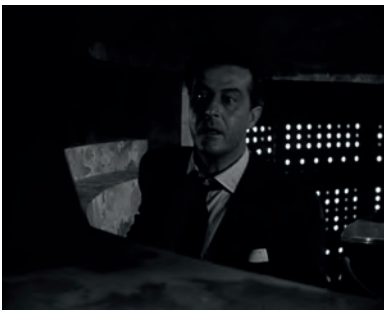
Abb. 1.1-5 Spiel mit dem Tode

Spiel mit dem Tode (The Big Clock, USA 1948, John Farrow)