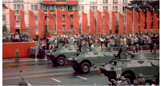
Abb. 1.1-14, -15 Good Bye, Lenin!

standen werden. Seine Aufgabe besteht hier mehr in der Schaffung einer ironischen Distanz zum Geschehen, die eine allzu enge Identifikation mit den Protagonisten verhindert. Die Stimme aus dem Off bringt den Verlauf der Geschichte nicht wirklich voran, vielmehr reflektiert sie das politische Geschehen im Rückblick und betont die Absurdität der Handlung.