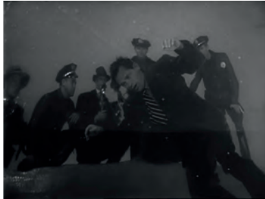
Abb. 1.1-9 Boulevard der Dämmerung

Boulevard der Dämmerung treibt das Element des Unausweichlichen auf die Spitze: Der Protagonist des Films, der auch als Erzähler fungiert, liegt zu Beginn des Films bereits tot im Swimming Pool einer Villa in Hollywood. Auf der Tonspur berichtet er davon, dass ein Mord passiert sei, und er spricht den Zuschauer direkt an: