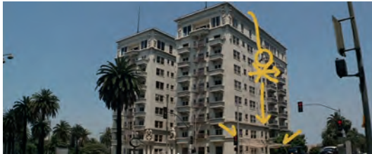
Abb. 1.1-23 Magnolia

dass der Soundso von Einem den Soundso von dem Anderen trifft und so weiter. Und nach der unmaßgeblichen Meinung dieses Erzählers passieren solche eigenartigen Sachen andauernd. Und immer wieder und immer wieder. Und es steht geschrieben „Wir haben mit der Vergangenheit abgeschlossen. Aber die Vergangenheit nicht mit uns.“