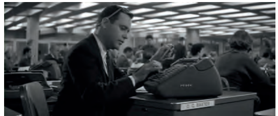
Abb. 1.1-10, -11, -12 Das Apartment

High Fidelity (USA, Großbritannien 2000, Stephen Frears)