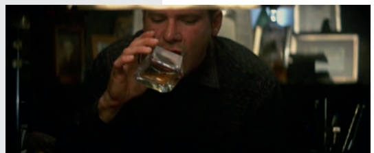
Abb. 1.1-19, -20, -21 Blade Runner