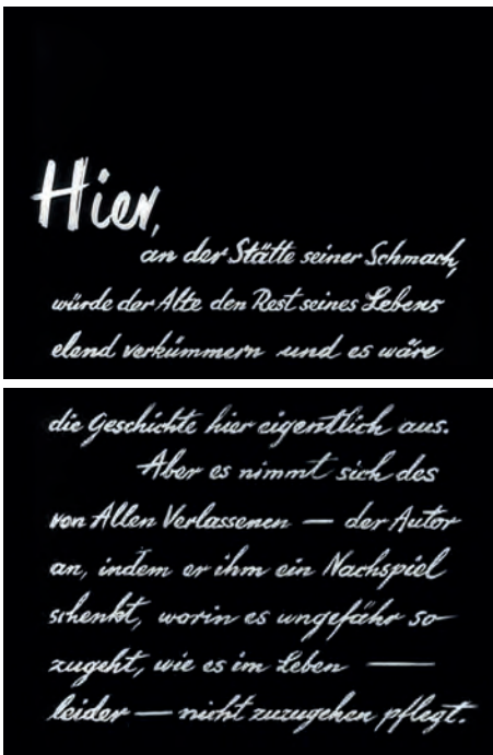
Abb. 1.1-3, 1.1-4 Der letzte Mann

Metropolis (Deutschland 1927, Fritz Lang)