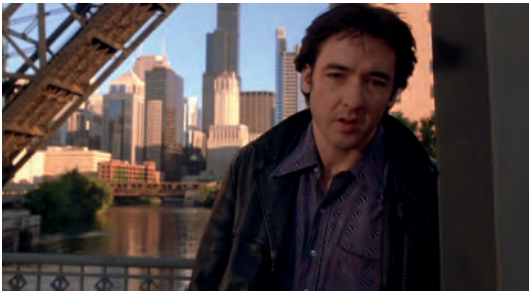
Abb. 1.1-13 High Fidelity

Art, das Leben zu sehen. Hierdurch entwickelt sich eine Art Komplizenschaft zwischen Rob und dem Zuschauer. Sein Leben zwischen Beziehungsstress und perfekter Plattensammlung wird nachvollziehbar, weil es ganz aus seiner Sicht gezeigt und kommentiert wird. Gleichzeitig wird durch diese Erzählstrategie aber auch ein Eintauchen des Zuschauers in die erzählte Welt verhindert. Die dargestellte Welt wird nicht als in sich geschlossen und damit als echt oder glaubwürdig wahrgenommen. Die Illusionsbildung, die ein