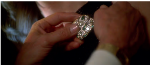
Abb. 1.1-16, -17, -18 Casino

Auch wenn die Aufteilung der Erzählerstimme auf mehrere Charaktere eine eindeutige Fokussierung auf eine Figur verhindert, so wird doch im Film eine durchgängig männliche Perspektive eingenommen.