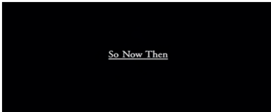
Abb. 1.1-24 Magnolia

Die Erläuterungen des Erzählers werden mit einer Texttafel eingeleitet (Abb. 1.1-24), die den Zuschauer aus der bis dahin angewendeten szenischen Erzählweise löst und ihn zurück zu dem erzählerischen Rahmen bringt, der am Anfang deutlich wurde. „So now then...“ leitet die Zusammenfassung, die ‚Moral‘ der Geschichte ein und schafft eine Einordnung in größere, hier