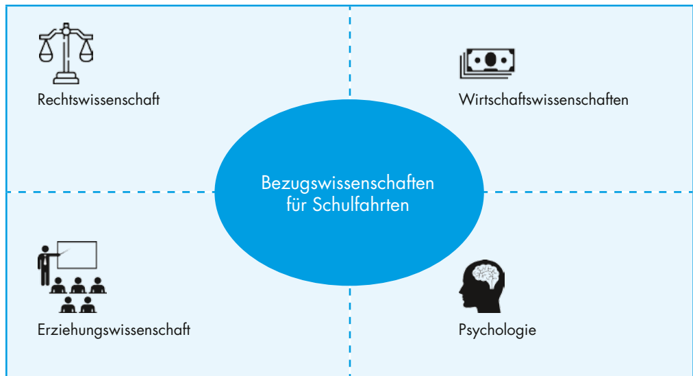
Abb. 2: Bezugswissenschaften für Schulfahrten

Im Anschluss daran wird die jeweilige Situation grundlegend aufbereitet – ausgehend von Praxisfällen und angereichert mit Tipps, Empfehlungen, Hinweisen und Beispielen aus Praxis und Theorie. Dabei steht die Praxis im Mittelpunkt, da die Situationen von dort stammen; handlungsleitende Theorien aus verschiedenen Bezugswissenschaften (Erziehungswissenschaft, Psychologie, Wirtschaftswissenschaften und Rechtswissenschaft) bilden oft einen Hintergrund, der zu Fundierung und Begründung beiträgt.