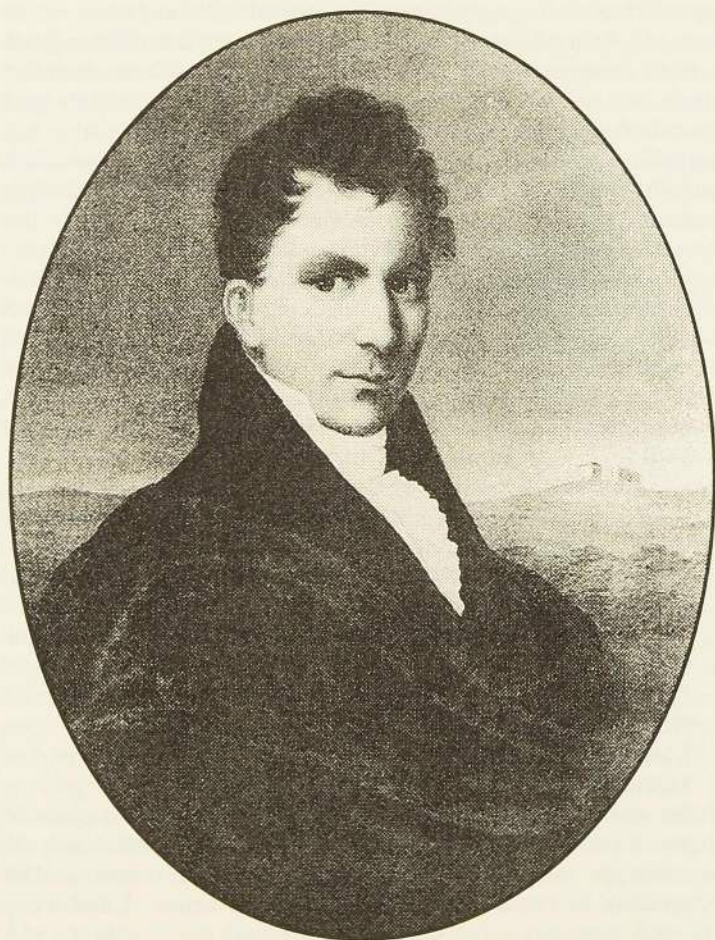
Abb. 2 B.A. von Lindenau (1780-1854) mit Seeberg-Sternwarte. Gemälde von Louise Seidler (1811). Lindenau-Museum Altenburg