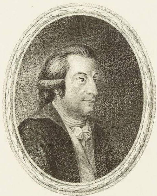
Franz Xaver von Zach 13.6.1754 - 2.9.1832

Abb. 1 Offenbar vielfach als Einzelblatt verteilt, steht dieses Bild auch am Beginn des 49. Bandes von Nicolais Neuer Allgemeiner deutschen Bibliothek (1800). 1800 wurde Zach Auswärtiges Mitglied der Berliner Akademie der Wissenschaften.