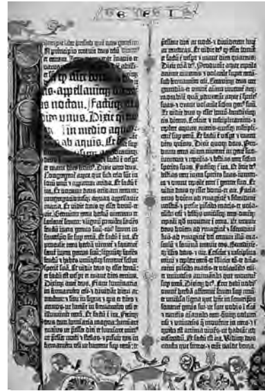
Anfang der Genesis aus der Gutenberg-Bibel (um 1450) mit einem Lesestein (Nachbildung)

Arabische Wissenschaftler haben sich bereits vor Alhazen mit optischen Fragen befasst, so AL FAOLI um 900 und ABU HAITHAM um 1000, jedoch sind ihre Werke verschollen.